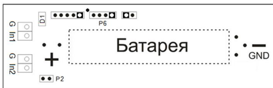
Рисунок 3.1 – Расположение контактов Модуля

Описание контактов модуля приведены на рисунке 3.1 и в таблице 3.1.