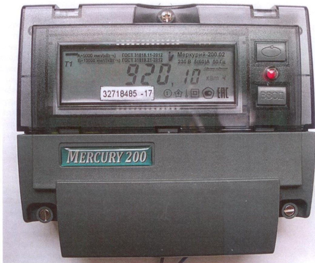
Рисунок 1 - Внешний вид счетчика с закрытой клеммной крышкой

Внешний вид счетчика с закрытой клеммной крышкой приведен на рисунке 1.